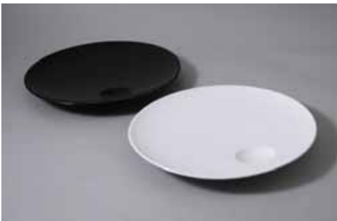
結(ゆい) デザイン:小林和生 白、黒 6,300円 (25cm)