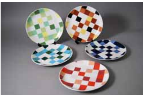
feels(フィールズ) デザイン:立石甲介 3,570円 (紺、茶、青、緑、赤) (19cm)