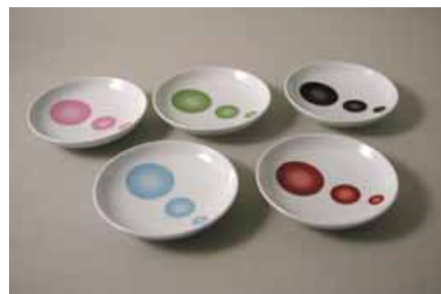
ビーンズ 小皿 1,050円 (黒、赤、桃、青、緑) 12cm)