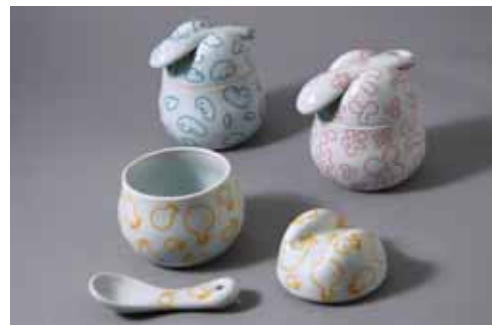
B 3,675円 (赤、青、黄) (8.5×H10.5cm)