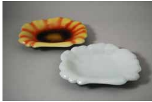
花夢 デザイン:綿引友子 花柄 5,250円 青磁 4,250円 (19×26cm)