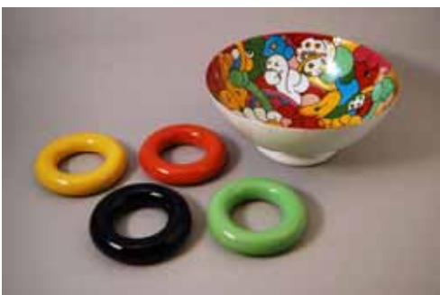
主役皿 (メインディッシュ) デザイン:白井こゆる 鉢 31,500円、錦高台皿2,940円 白 鉢15,750円、白高台皿2,520円 (鉢 30.5×H12cm、高台皿 14.8×3.4cm)