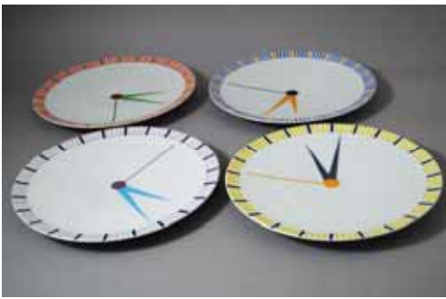
時計皿 デザイン:梅原靖司 3,990円 (赤、青、黄、紫) (25cm)