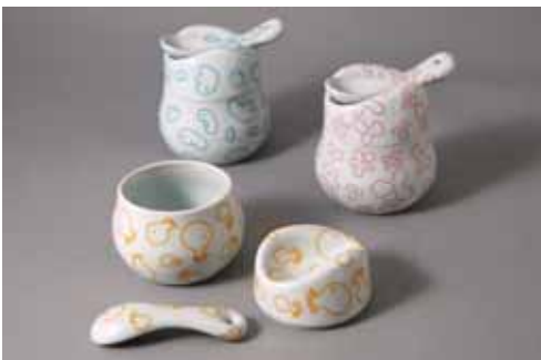
チアーズ デザイン:細野仁美 A 3,675円 (赤、青、黄) (8.5×H10.5cm)