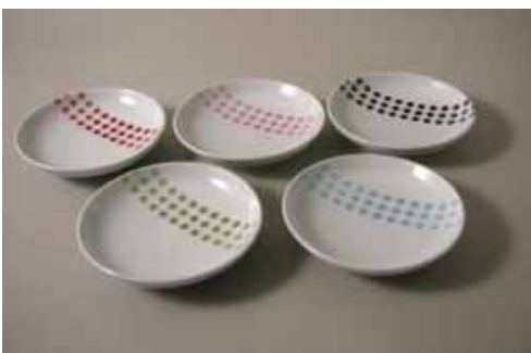
コスモス 小皿 1,050円 (黒、赤、桃、青、緑) (12cm)