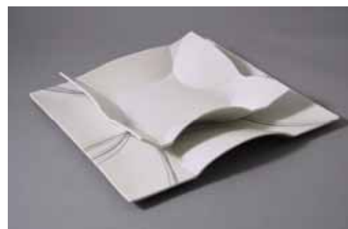
有田の今に咲く花、華 デザイン:神村真由美 大 7,350円 小 3,675円 (大28.5×28.5cm、小22×22cm)