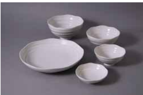
yurayura (ユラユラ) デザイン:村田英樹 白:大碗2,100円、中碗1,575円、小碗1,260円 21cm皿2,625円、9cm皿840円 (大碗 13.5cm、中碗 12cm、小碗 10cm)