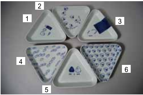
おにぎり入れ デザイン:橋本佳代子 1出会い、2おもすびころりん、3特大おにぎり、 4こめつぶ暴走中、5のりとお米、6おにぎり会議 大 1,050円 (17×17cm) 小 735円 (11×11cm)