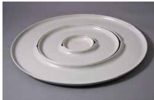
和 デザイン:川瀬和幸 大 7,980円 (39cm) 中 6,300円 (25cm) 小 420円 (8cm)