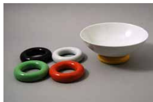
白 鉢2,940円、白高台皿1,575円 錦高台皿1,680円 (鉢 19.3×H6.9cm、高台皿 9cm×H2.2cm)