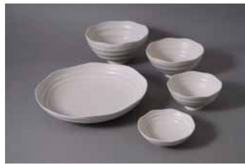
Silkmaica: 大碗2,310円、中碗1,785円、小碗1,365円 21cm皿2,940円、9cm皿1,050円 (大碗 13.5cm、中碗 12cm、小碗 10cm)